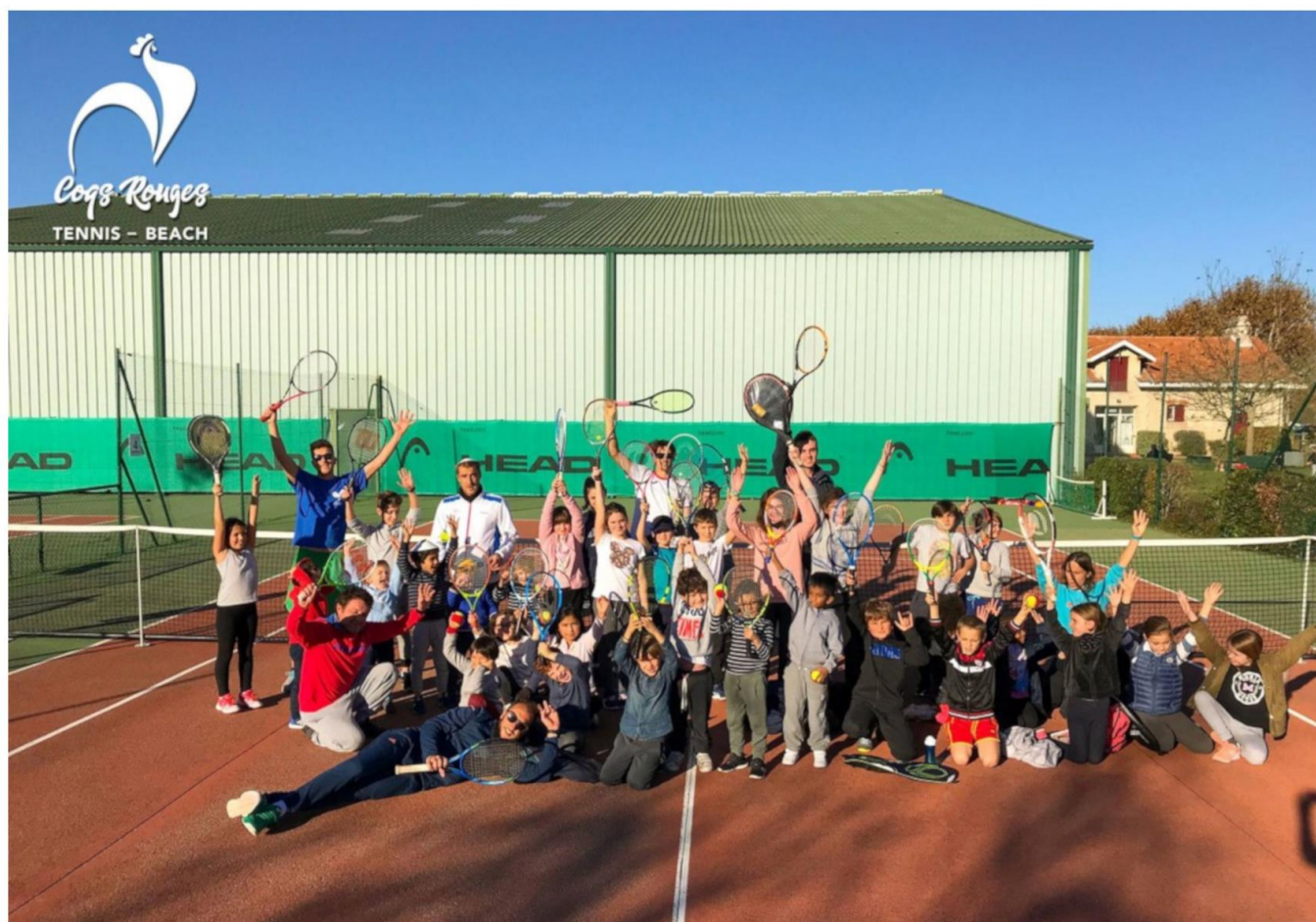
Tableau final et matchs de classements dimanche et lundi

Qualifications samedi matin et début d'après-midi